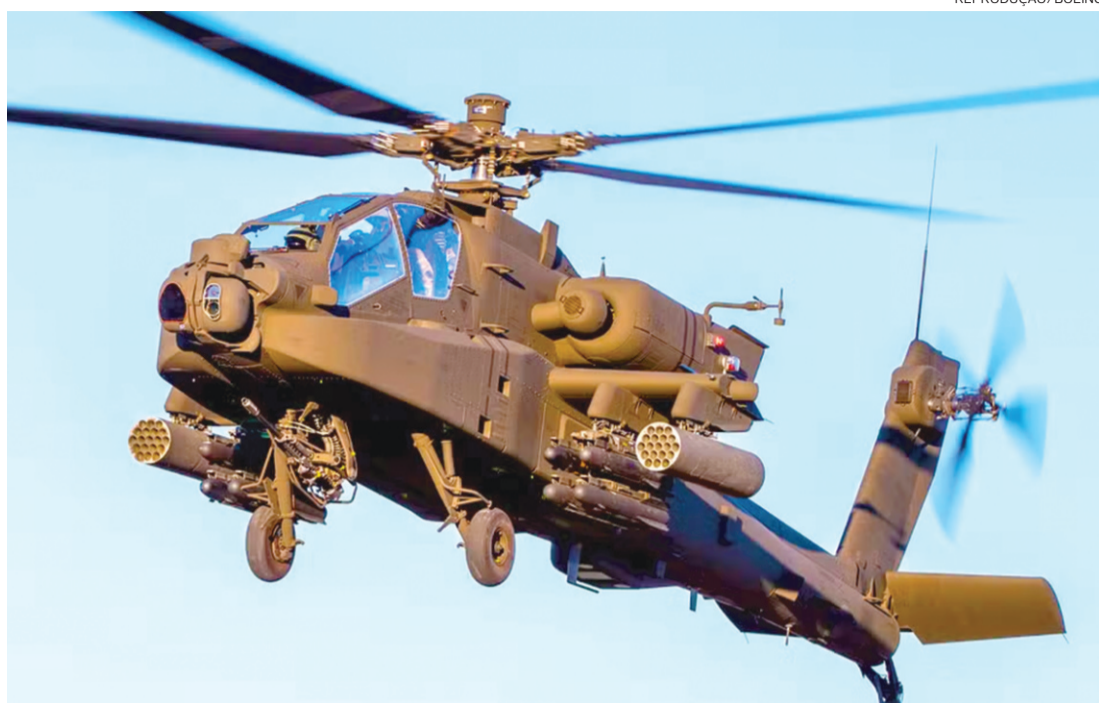
Os helicópteros AH-64 Apache têm sido um recurso fundamental para as Forças Armadas americanas

O helicóptero caiu enquanto o Oriente Médio ainda se recuperava após Irã e Israel trocaram tiros no dia anterior, no maior golpe até